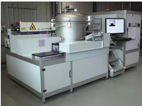
Abbildung 1: Das Projekt EnerTHERM wird vom Bayerischen Wirtschaftsministerium mit 9,5 Mio. Euro gefördert