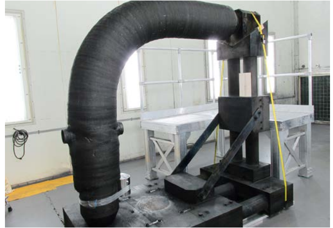
CMC-armierter Stahl-Rohrleitungsbogen in der Haltekonstruktion für die Ofenpyrolyse.