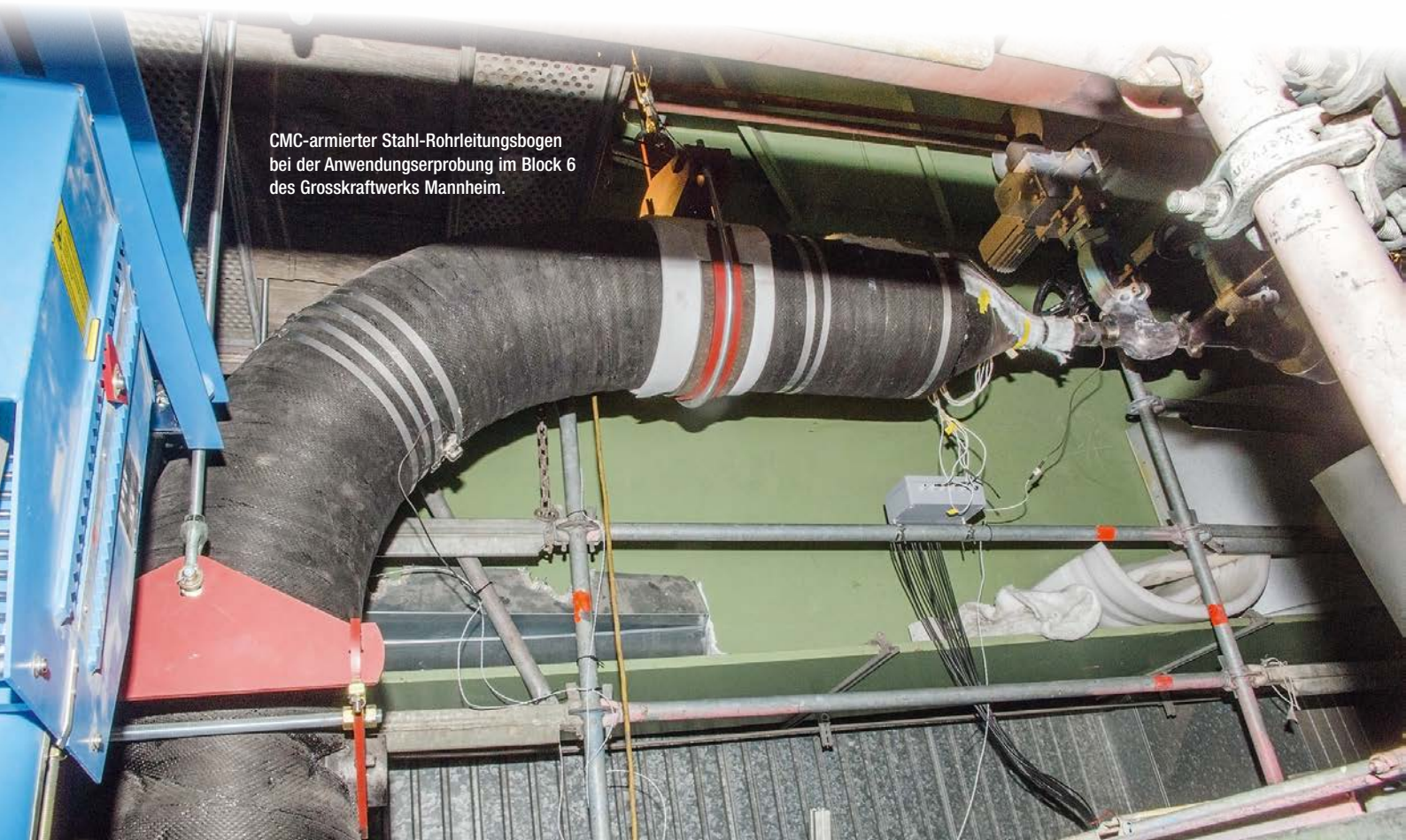
CMC-armierter Stahl-Rohrleitungsbogen bei der Anwendungserprobung im Block 6 des Grosskraftwerks Mannheim.

Einen zukunftsweisenden Ansatz, um die Prozessparameter Druck und Temperatur zu erhöhen und gleichzeitig zügige und überschaubare Reparaturen zu ermöglichen, stellt ein neues Armierungssystem dar. Zur Umhüllung von metallischen Rohrleitungen (Liner) kommt hier ein höchst kriechbeständiger keramischer Faserverbundwerkstoff (CMC) in der Funktion einer stützenden